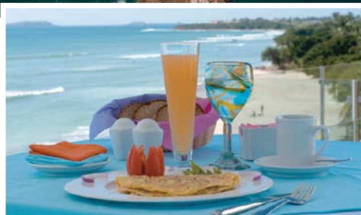
Breakfast at Cielo | Desayuno en Cielo

When it's time to enjoy a nice meal by the ocean, be it breakfast, brunch or dinner, many beachfront towns near Puerto Vallarta feature a number of restaurants offering traditional food. By contrast, the dozen or so eateries along Avenida El Anclote feature unique and diverse gastronomy for every taste and budget. You will be able to access the beach from just about any one of them, or you can use one of the three public beach accesses located in town.