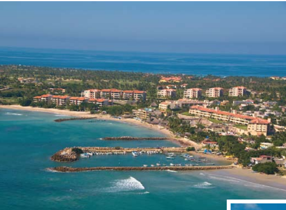
Playa El Anclote

Driving to El Anclote from Puerto Vallarta takes approximately an hour along Carr. 200 Norte, taking the Punta de Mita/La Cruz exit right after Bucerías. Some of the best fishing in the bay can be enjoyed near El Anclote, a number of vessels available to you at the ideal spots for you to enjoy a good catch, and many of the local restaurants will eagerly grill it for you afterward!